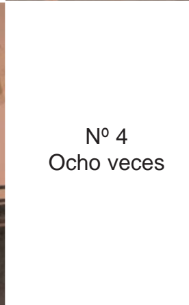
Nº 4 Ocho veces