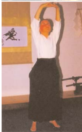
Nº 1 Ocho veces