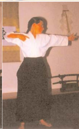
Nº 2 Ocho veces por cada lado