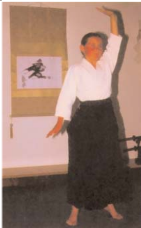
Nº 3 Ocho veces por cada lado